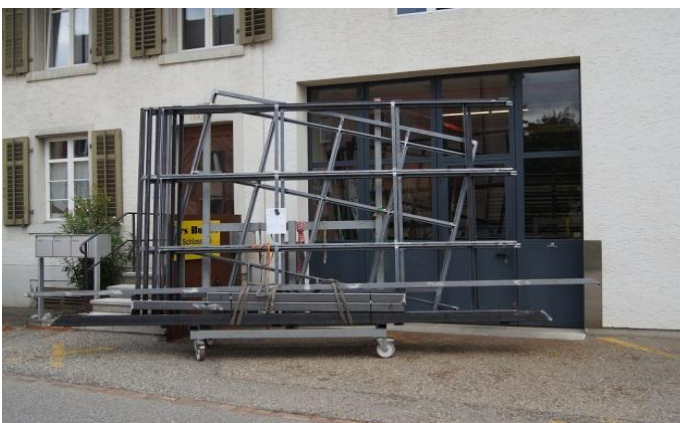
Alle Teile sind bereit für die Verzinkerei. Sie werden abgeholt, feuerverzinkt und weiss duplexiert.