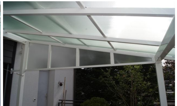
Gegen Süden ist eine Dreieckverglasung zur Stabilisation.