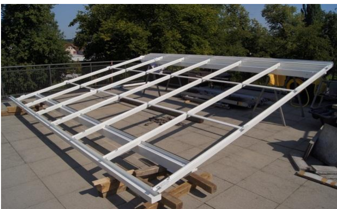
Die Dachkonstruktion wird zusammen geschraubt,