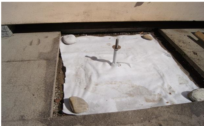
Die Isolation und Abdichtung sind wieder ergänzt.