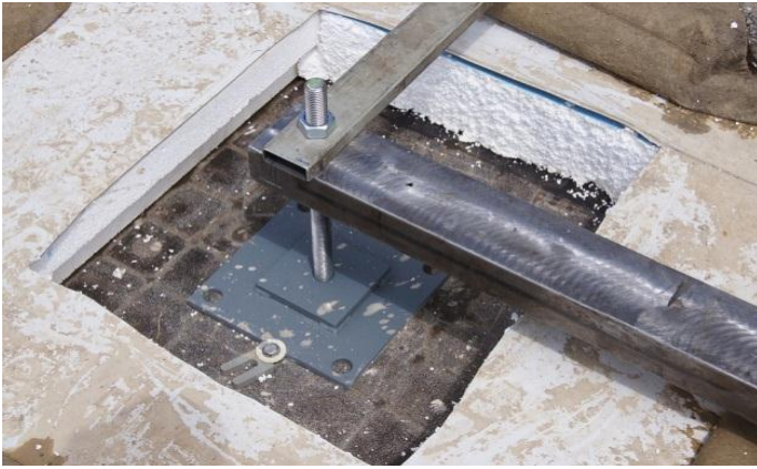
Die Isolation ist aufgeschnitten, die Nivellierfüsse plaziert.