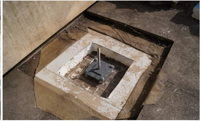
Die Nivellierfüsse sind auf die Betondecke gedübelt.