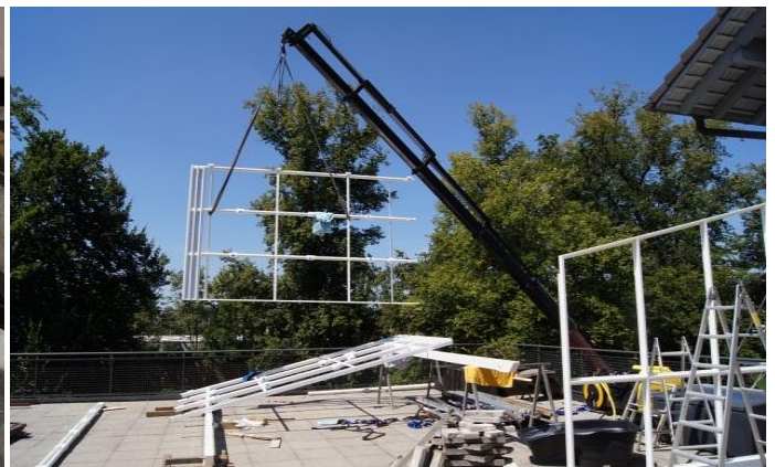
Die Bauteile werden mit einem Lastwagenkran auf die Terrasse gehoben.