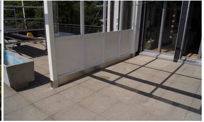
Der Sockel der Seitenwand und die Pfosten sind mit Chromstahlblechen verkleidet.