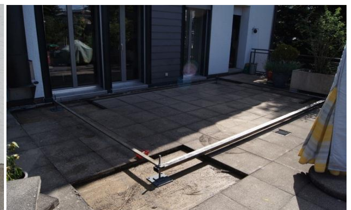
Die Gartenplatten sind wo nötig entfernt und die Versetzlehre plaziert.