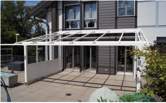
Das fertige Dach, noch ohne Dachgläser.