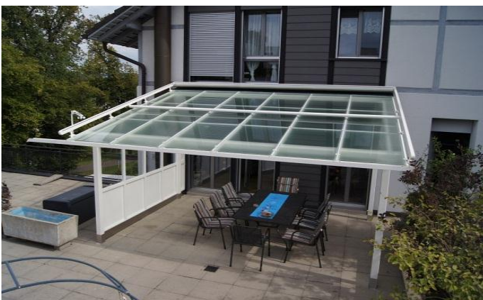
Die Dachgläser, VSG aus Spez. 59 und Floatglas sind eingesetzt. Die Gläser sind nicht ganz durchsichtig.