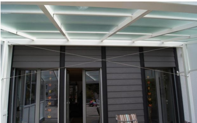
Quer wird das Dach durch einen Windverband mit Chromstahlseilen stabilisiert.