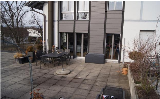
Bestehende Situation auf der Terrasse.