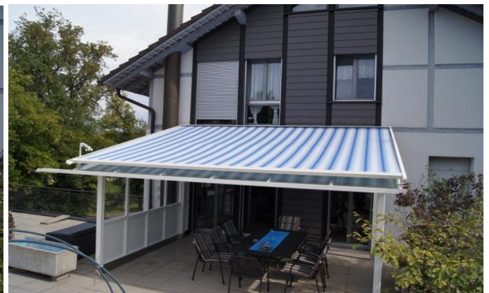
Die Wintergartenbeschattung der Fa. Tschanz mit Sonnen- und Windwächter ist montiert.