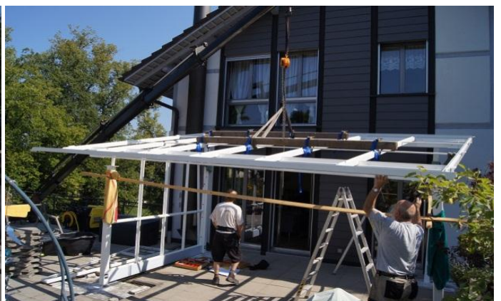
und dann auf die Stützen gehoben.